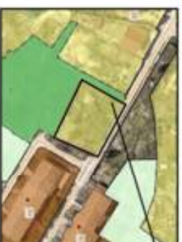
Ж-1 Зона застройки индивидуальными жилыми домами