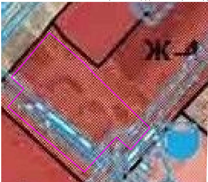
Рис. 1. Схема расположения проектируемого земельного участка относительно территориальных зон.

В зонах жилой многоэтажной застройки допускается размещение объектов, связанных с проживанием граждан и не оказывающих негативного воздействия на окружающую среду, размещение подземных гаражей и автостоянок; спортивных и детских площадок, площадок отдыха и иных объектов в случаях, предусмотренных настоящей статьей. Объектов обслуживания жилой застройки во встроенных, пристроенных и встроенно-пристроенных помещениях многоквартирного дома, должно быть не более 20% от общей площади помещений дома.