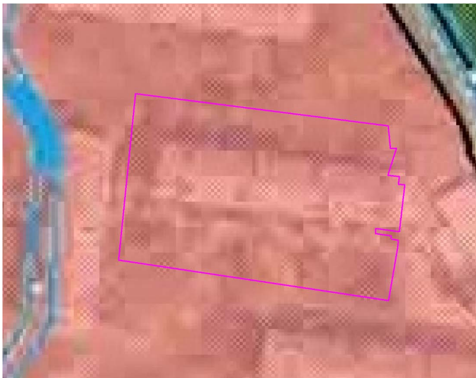
Рис. 1. Схема расположения проектируемого земельного участка относительно территориальных зон.

В зонах застройки среднеэтажными жилыми домами допускается размещение объектов, связанных с проживанием граждан и не оказывающих негативного воздействия на окружающую среду, а также размещение подземных гаражей и автостоянок; обустройство спортивных и детских площадок, площадок отдыха и иных объектов.