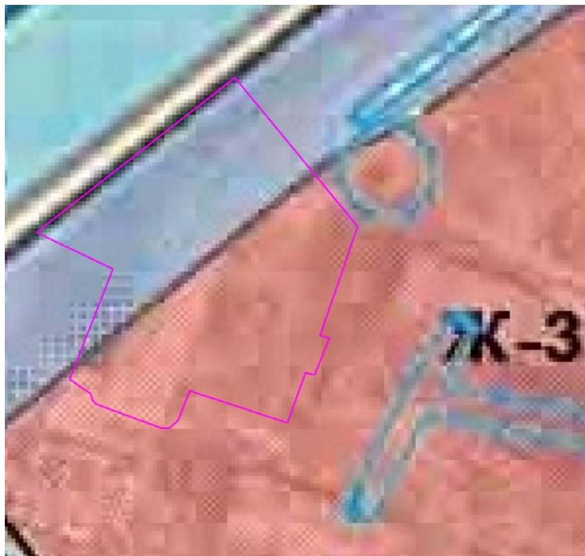
Рис. 1. Схема расположения проектируемого земельного участка относительно территориальных зон.

В зонах застройки среднеэтажными жилыми домами допускается размещение объектов, связанных с проживанием граждан и не оказывающих негативного воздействия на окружающую среду, а также размещение подземных гаражей и автостоянок; обустройство спортивных и детских площадок, площадок отдыха и иных объектов.