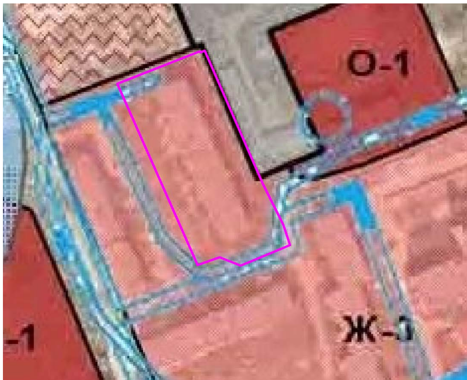
Рис. 1. Схема расположения проектируемого земельного участка относительно территориальных зон.

В зонах застройки среднеэтажными жилыми домами допускается размещение объектов, связанных с проживанием граждан и не оказывающих негативного воздействия на окружающую среду, а также размещение подземных гаражей и автостоянок; обустройство спортивных и детских площадок, площадок отдыха и иных объектов.