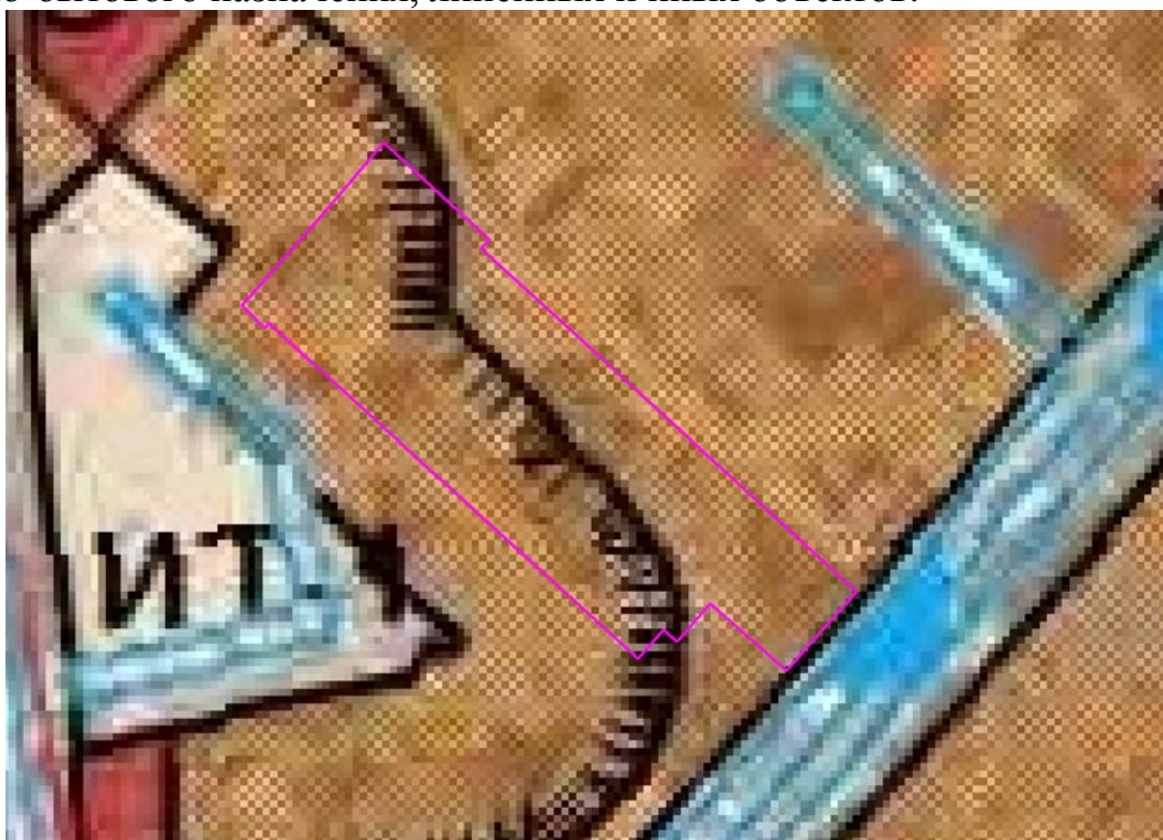
Рис. 1. Схема расположения проектируемого земельного участка относительно территориальных зон.

В зонах застройки малоэтажными многоквартирными жилыми домами допускается размещение объектов, связанных с проживанием граждан и не оказывающих негативного воздействия на окружающую среду, а также стоянок, гаражей, площадок для временной парковки автотранспорта, объектов социального, коммунально-бытового назначения, линейных и иных объектов.