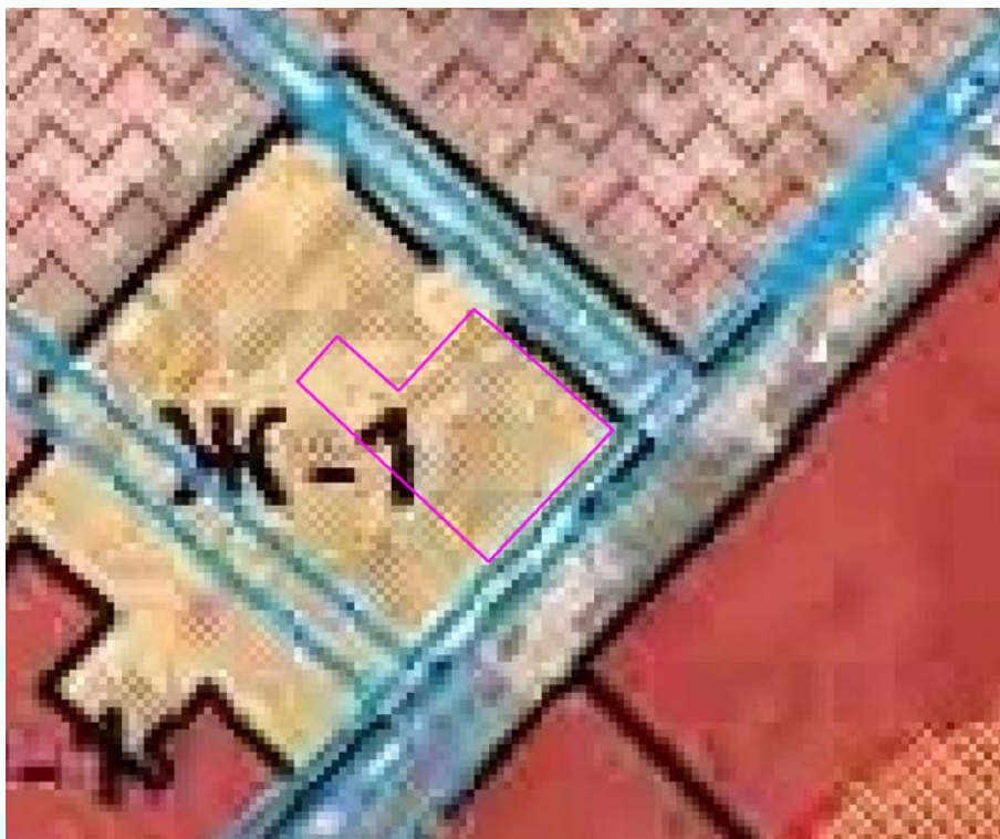
Рис. 1. Схема расположения проектируемого земельного участка относительно территориальных зон.

В зонах застройки индивидуальными жилыми домами допускается размещение объектов, связанных с проживанием граждан и не оказывающих негативного воздействия на окружающую среду, а также гаражей, площадок для временной парковки автотранспорта, объектов социального, коммунально-бытового назначения, линейных и иных объектов.