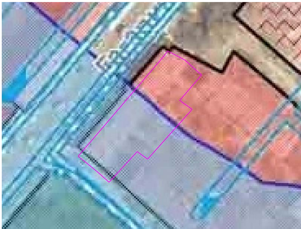
Рис. 1. Схема расположения проектируемого земельного участка относительно территориальных зон.

В зонах застройки среднеэтажными жилыми домами допускается размещение объектов, связанных с проживанием граждан и не оказывающих негативного воздействия на окружающую среду, а также размещение подземных гаражей и автостоянок; обустройство спортивных и детских площадок, площадок отдыха и иных объектов.