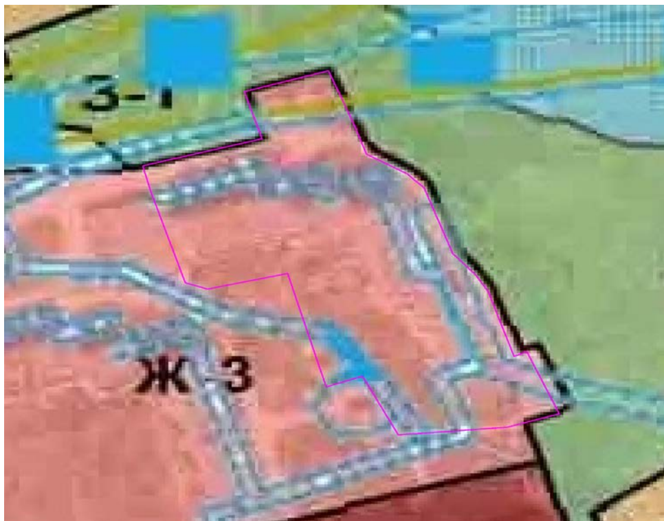
Рис. 1. Схема расположения проектируемого земельного участка относительно территориальных зон.

В зонах застройки среднеэтажными жилыми домами допускается размещение объектов, связанных с проживанием граждан и не оказывающих негативного воздействия на окружающую среду, а также размещение подземных гаражей и автостоянок; обустройство спортивных и детских площадок, площадок отдыха и иных объектов.