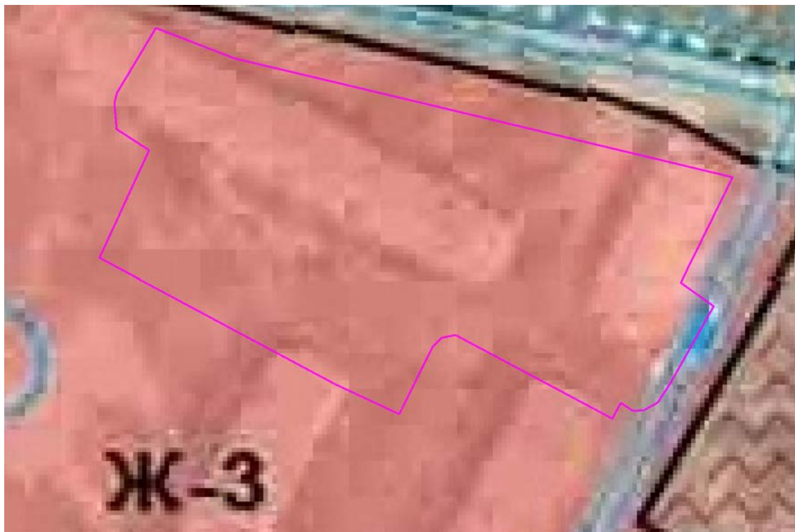
Рис. 1. Схема расположения проектируемого земельного участка относительно территориальных зон.

В зонах застройки среднеэтажными жилыми домами допускается размещение объектов, связанных с проживанием граждан и не оказывающих негативного воздействия на окружающую среду, а также размещение подземных гаражей и автостоянок; обустройство спортивных и детских площадок, площадок отдыха и иных объектов.