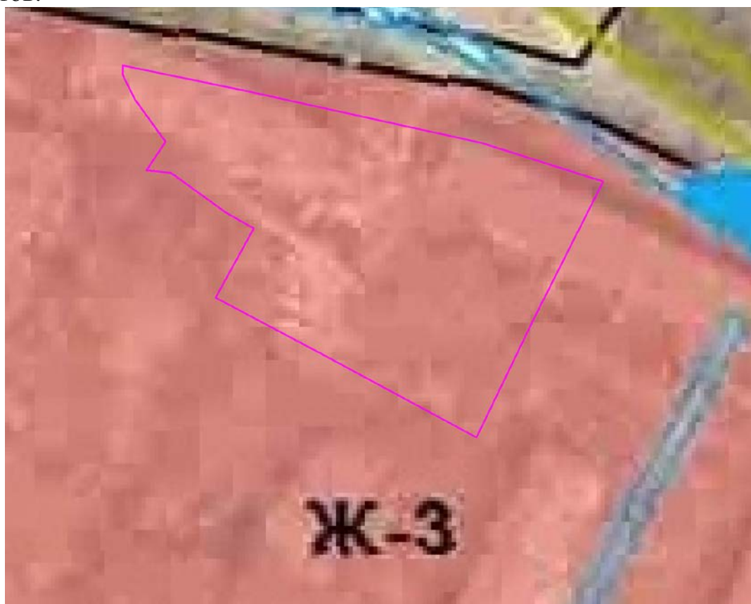
Рис. 1. Схема расположения проектируемого земельного участка относительно территориальных зон.

В зонах застройки среднеэтажными жилыми домами допускается размещение объектов, связанных с проживанием граждан и не оказывающих негативного воздействия на окружающую среду, а также размещение подземных гаражей и автостоянок; обустройство спортивных и детских площадок, площадок отдыха и иных объектов.