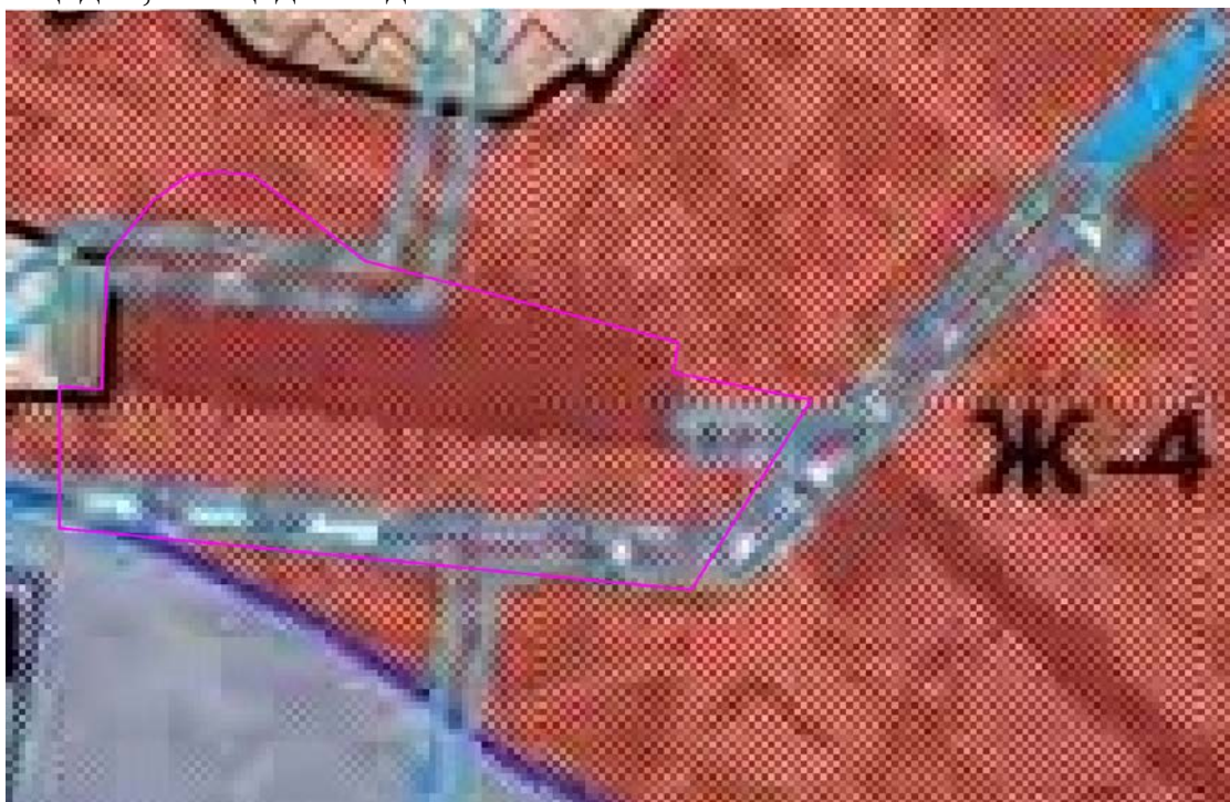
Рис. 1. Схема расположения проектируемого земельного участка относительно территориальных зон.

В зонах жилой многоэтажной застройки допускается размещение объектов, связанных с проживанием граждан и не оказывающих негативного воздействия на окружающую среду, размещение подземных гаражей и автостоянок; спортивных и детских площадок, площадок отдыха и иных объектов.