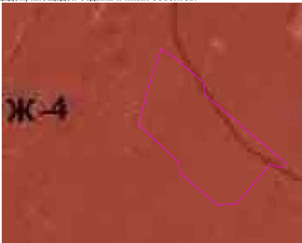
Рис. 1. Схема расположения проектируемого земельного участка относительно территориальных зон.

В зонах жилой многоэтажной застройки допускается размещение объектов, связанных с проживанием граждан и не оказывающих негативного воздействия на окружающую среду, размещение подземных гаражей и автостоянок; спортивных и детских площадок, площадок отдыха и иных объектов.