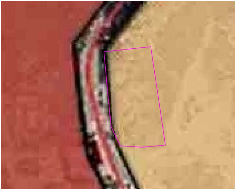
Рис. 1. Схема расположения проектируемого земельного участка относительно территориальных зон.

В зонах застройки индивидуальными жилыми домами допускается размещение объектов, связанных с проживанием граждан и не оказывающих негативного воздействия на окружающую среду, а также гаражей, площадок для временной парковки автотранспорта, объектов социального, коммунально-бытового назначения, линейных и иных объектов.