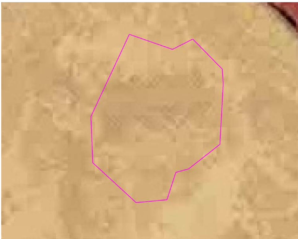
Рис. 1. Схема расположения проектируемого земельного участка относительно территориальных зон.

В зонах застройки индивидуальными жилыми домами допускается размещение объектов, связанных с проживанием граждан и не оказывающих негативного воздействия на окружающую среду, а также гаражей, площадок для временной парковки автотранспорта, объектов социального, коммунально-бытового назначения, линейных и иных объектов.