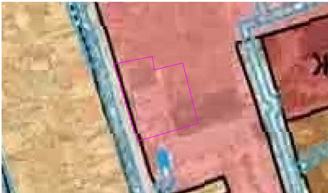
Рис. 1. Схема расположения проектируемого земельного участка относительно территориальных зон.

В зонах застройки среднеэтажными жилыми домами допускается размещение объектов, связанных с проживанием граждан и не оказывающих негативного воздействия на окружающую среду, а также размещение подземных гаражей и автостоянок; обустройство спортивных и детских площадок, площадок отдыха и иных объектов.